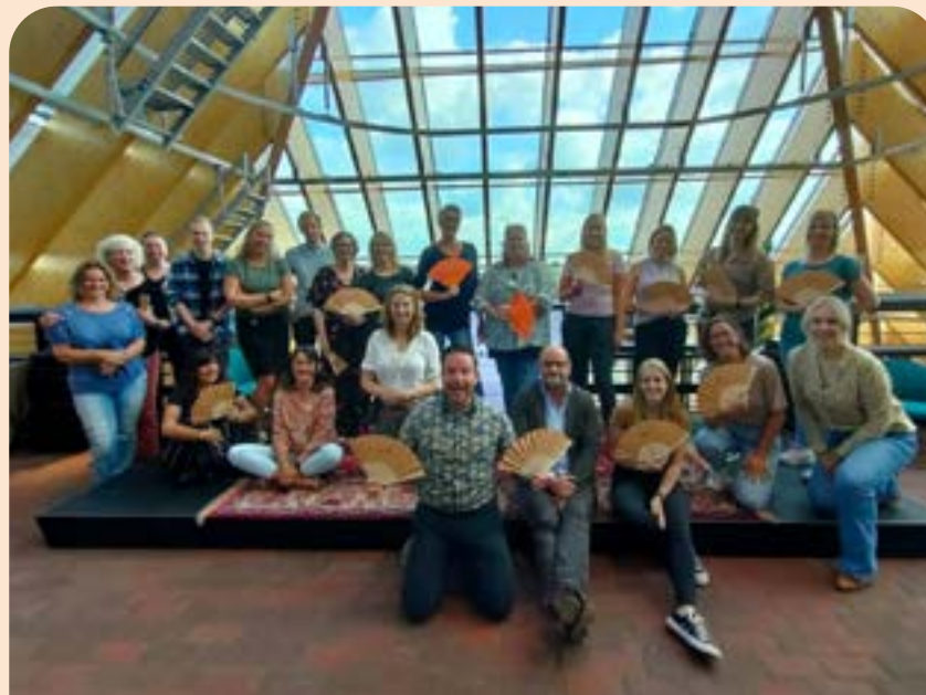
Personeel en vrijwilligers kwamen meerdere malen samen

Op het gebied van HR slaan we de handen steeds meer ineen met Bibliotheek Zuid-Hollandse Delta. Dit uit zich onder meer in het aantrekken van een gezamenlijke projectcoördinator Digitale Inclusie en Informatiepunt Digitale Overheid (IDO) en projectcoördinator Educatie.