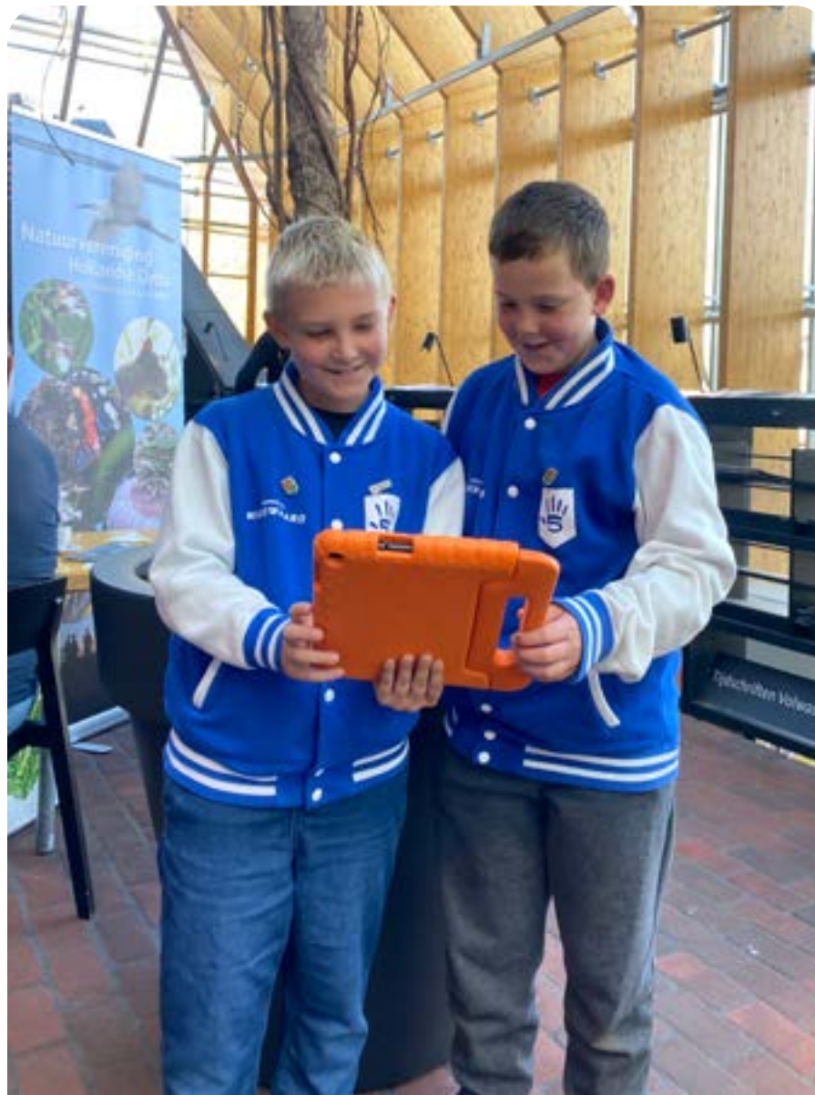
Lancering van de duurzame game tijdens het eerste duurzame café