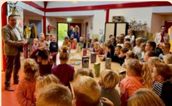
Opening Bibliotheek op school