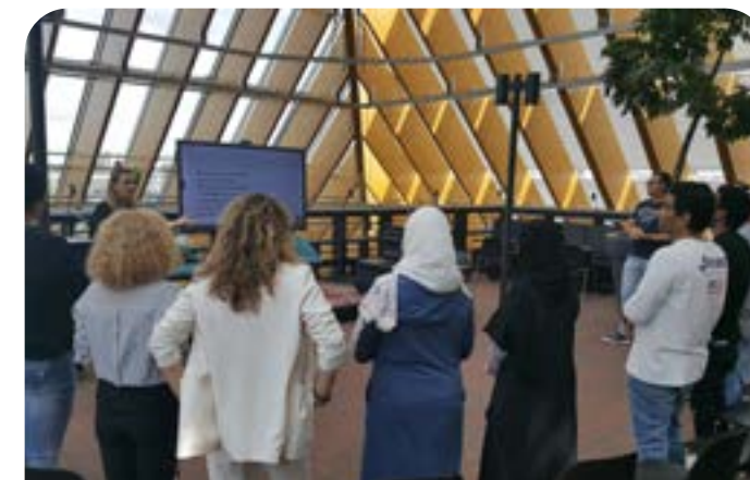
'Zing Nederlands met me' tijdens de Week van lezen en schrijven