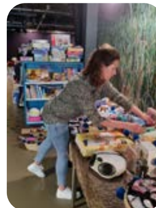
Inzamelingsactie voor vluchtelingen uit Oekraïne