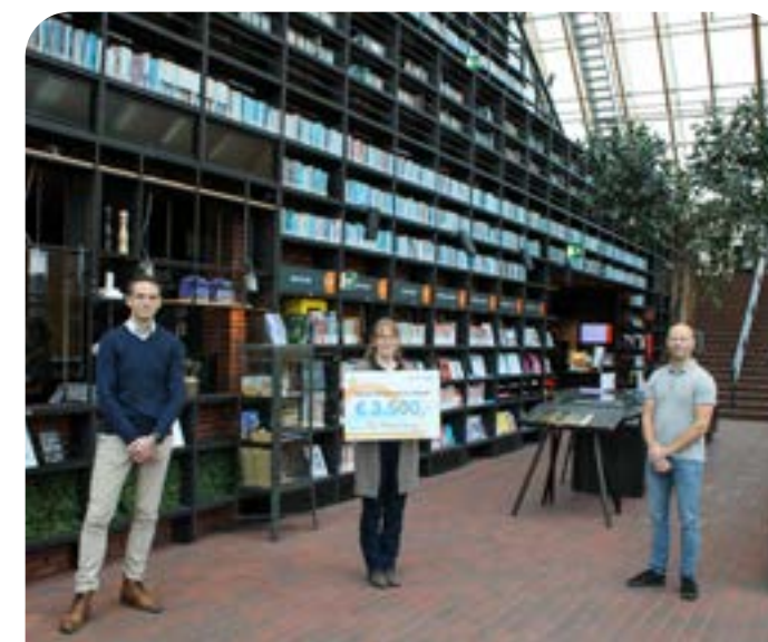
Het DigiTaalhuis ontving financiële stimulans van BP en Visser & Smit Hanab